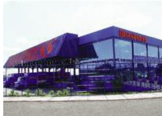
A filial de Presidente Prudente ocupa uma nova área desde abril passado

8) Filial de Salvador (BA) em ampliação: Locação de novo prédio com área total de 15.300 metros quadrados, sendo 7.000 metros quadrados de construção - 42 docas simultâneas de carga e descarga. Ainda para Salvador, está previsto a verticalização de 60% da frota através de 10 veículos modelo MB - 710 - com início previsto para Julho/2010;