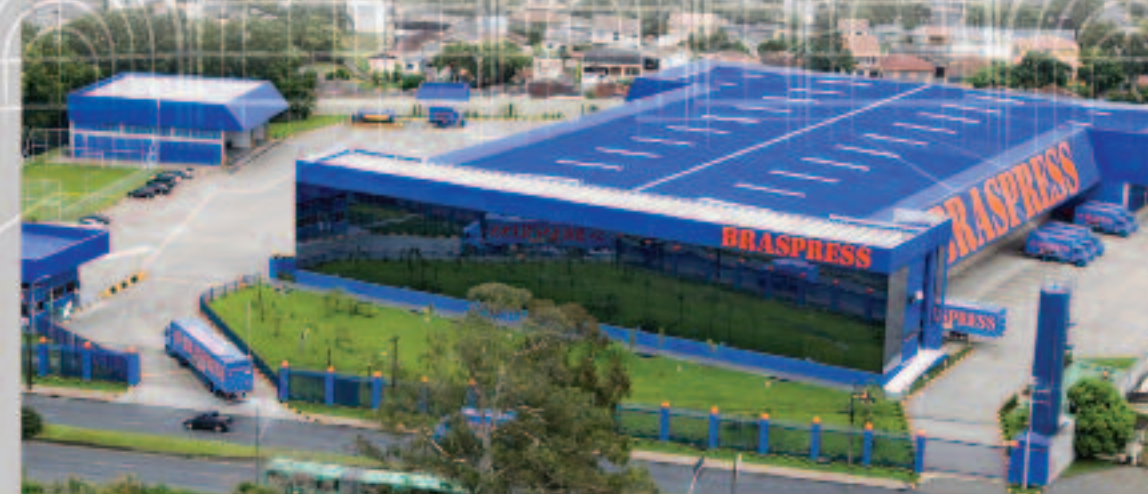
Novo Terminal BRASPRESS Curitiba/PR

Foi esta a forma que encontramos para agradecer ao Estado do Paraná. Inaugurando em Curitiba o mais moderno terminal de encomendas do estado, com área total de 33.000m 2 . Assim, daremos muito mais agilidade às nossas operações. Com 9 filiais no Estado do Paraná, a Braspress é a transportadora de encomendas que oferece a melhor capilaridade de distribuição de encomendas no estado paranaense.