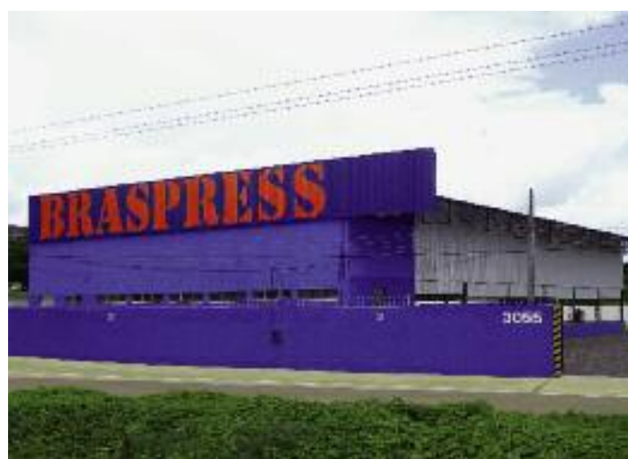
A filial de Sobral foi inaugurada no dia 5 de abril passado

maior agilidade nas operações”, explicou Urubatan Helou.