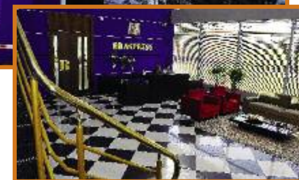
Recepção do terminal Curitiba em estilo clássico moderno