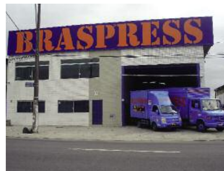
Filial de Santos ocupa uma nova área desde abril passado

4) Expansão da Filial de Blumenau (SC): Mudança no dia 12 de abril passado para um novo prédio com área total de 7.500 metros quadrados, sendo 4.000 metros quadrados de área construída com 30 docas simultâneas de carga e descarga.