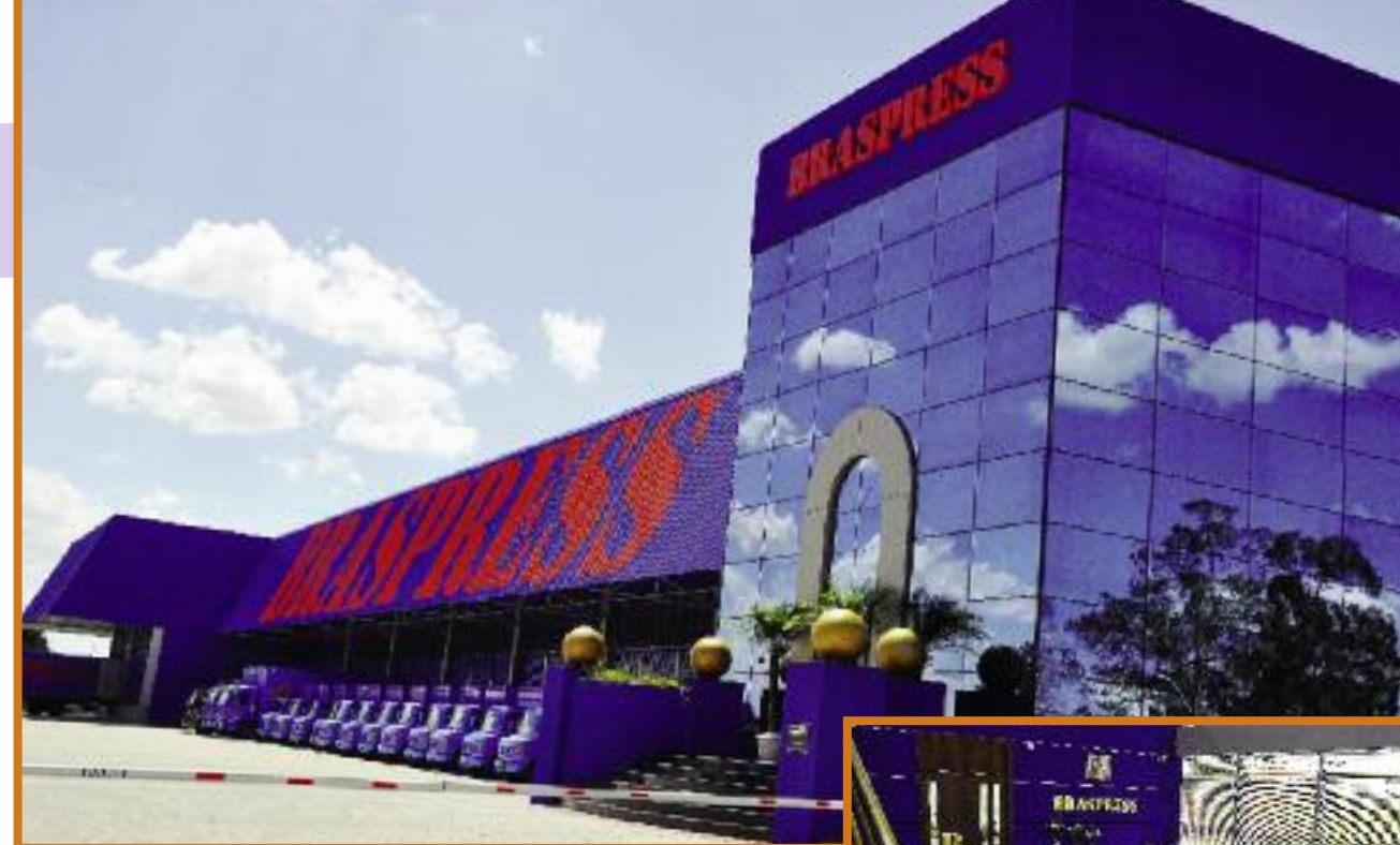
Fachada mantém-se dentro do padrão arquitetônico utilizado pela Organização, semelhante ao Terminal Rio de Janeiro

de área total e 11.900 metros quadrados de área construída, o novo terminal dispõe de 76 docas para carregamento/descarregamento simultâneos, Central de Monitoramento e Gerenciamento de Riscos, alojamento para motoristas, sala para Treinamento, refeitório, etc. Segundo o Diretor-Presidente