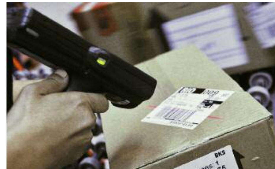
Os coletores são utilizados na rastreabilidade das encomendas

“Antes de a carga ser embarcada no veículo, a etiqueta é lida pelo coletor S730, da Intermecc, que transmite as informações ao sistema via radiofrequência (conexão sem fio Wi-Fi). Quando a carga é descarregada, o processo de leitura e transmissão de dados é repetido. Assim, podemos acompanhar todo o processo em tempo real e obter o controle e informações de todas as etapas e de cada ponto por onde passa 100% das encomendas identificadas com código de barras”, finalizou o Diretor de Operações. ■